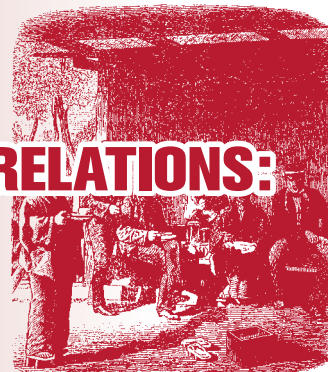
Dienstliche Secretariten im Wirtshaus von Onoi. Stad einer Photographie von S. Wiffen.