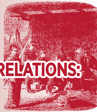
Dienfstelle Serradeten im Wirtshaus von Onori.