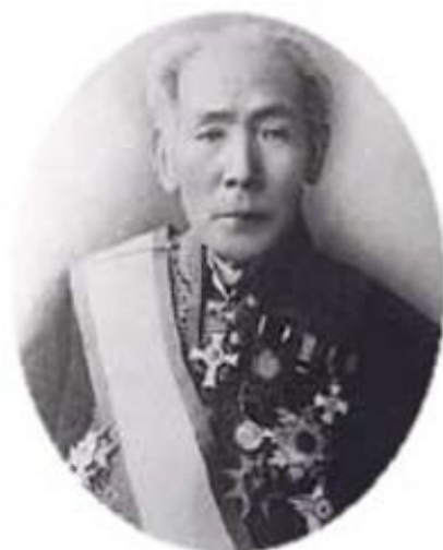
Sano Tsunetami im Alter

reiche und effiziente Infrastruktur aufbauen. Als im Jahre 1888 der Vulkan Bandai ausbrach und zahlreiche Opfer forderte, drängte Sano die Kaiserin, die Organisation bei der Katastrophenhilfe einsetzen zu dürfen, was ihm auch gewährt wurde. Die Gesellschaft bewährte sich dabei bestens. 37 Bei diesem Hilfseinsatz im zivilen Katastrophenfall ging das JRK erstmals über die eng definierten Einsatzgrundsätze der Genfer Konvention hinaus und setzte so neue Maßstäbe. Auch bei der medizinischen Versorgung der japanischen Zivilbevölkerung übernahm das Rote Kreuz die führende Rolle. Dies, obwohl seine Spitäler in erster Linie die Aufgabe hatten, für kranke und verwundete Angehörige der Streitkräfte zu sorgen und in Friedenszeiten der Ausbildung von militärischem Sanitätspersonal zu dienen. 38 Die Art und Weise, wie das Japanische Rote Kreuz seine Tätigkeit wahrnahm, sollte ihm während der Meiji-Zeit und bis zum Ende des Ersten Weltkrieges noch oft, auch internationale, Anerkennung eintragen.