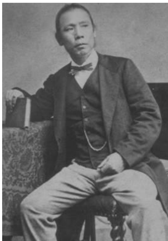
Der junge Sano Tsunetami

Auftrage des Fürsten (Daimyō) von Saga, Nabeshima Kansō (1814-1871), widmete er sich danach dem Aufbau einer Flotte und entwickelte Geschütze nach ausländischem Muster. Dank seinen Anstrengungen war Saga zum technologisch führenden Daimyat im spätfudalen Japan worden. 6